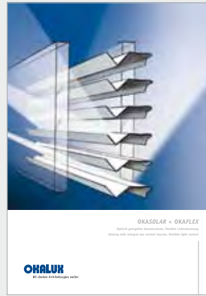
OKASOLAR + OKAFLEX