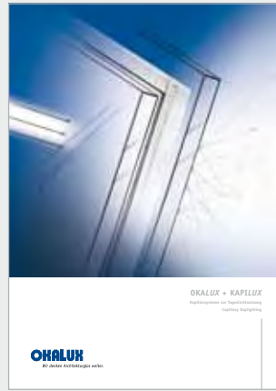
OKALUX + KAPILUX