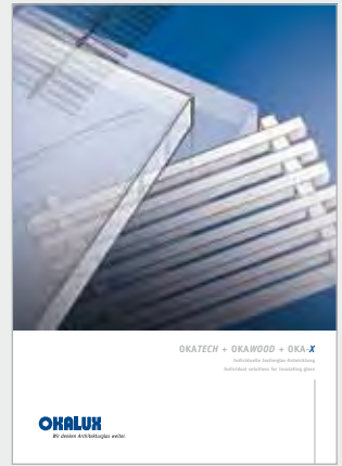
OKATECH + OKAWOOD + OKA X